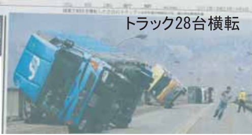
(今回の会報担当 山田 勉)